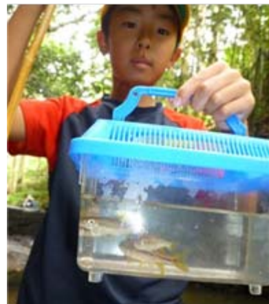
ビオトープPJT 小根田

草食恐竜も肉食恐竜も減ってしまったことを興味深く説明しました。時代が変わっても自然環境を大切にしましょう。参加者子供24名、父兄8名、環境スタッフ5名。魚釣り、サワガニ採り、ヒラタカゲロウ採集、ササブネ流しをして遊びました。(写真左)子供達にとっては初めての魚釣りの体験でしたが真剣に浮きの動きを見ていました。(写真上)食パンの餌で今日の釣果はカワムツを1時間で10匹も釣りました。後で川に放流してあげました。他にサワガニ40匹、メダカ(子供たちの呼び名。正確には“カワムツの幼魚”)10匹。