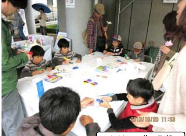
リサイクル工作に取り組み