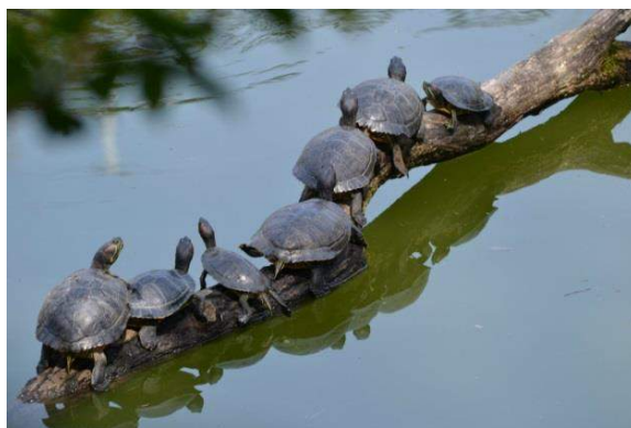
「亀の陣取り合戦」

撮影場所は長岡公園 入口西側の池 カモが沢山泳いでいました。ふと水に浸かった木に亀が並んでいるを見つけました。 亀の甲羅干しだ。 200mmの望遠で10枚撮った内の1枚です。濁った水が意外と美しく、又、右端の亀がとうせんぼしているのが面白い風景です。